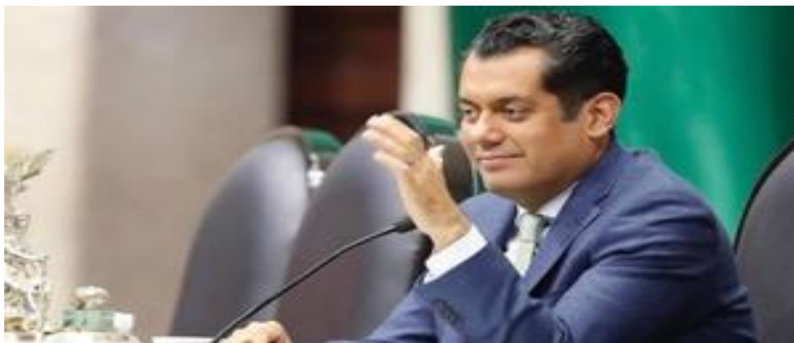
Presidente de la Mesa Directiva en el Palacio de San Lázaro, Sergio Gutiérrez Luna. Fotografía obtenida de: Milenio.

Fuente disponible en: https://www.eluniversal.com.mx/nacion/prd-advierde-en-san-lazaro-que-morena-pretende-posponer-discusion-de-reforma-electrica