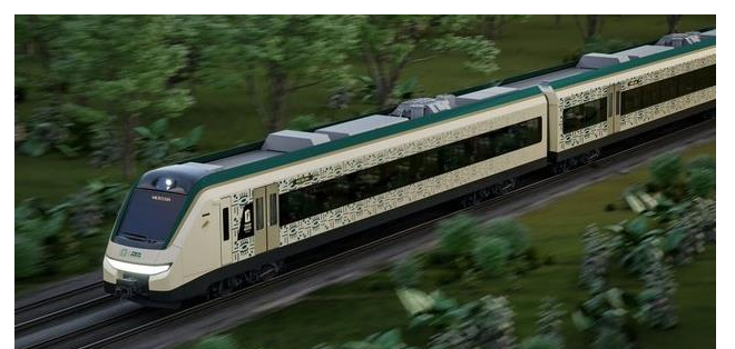
El Tren Maya estará listo en diciembre de 2023.

El gobierno federal, mediante la Secretaría de Hacienda y Crédito Público (SHCP), dio a conocer este miércoles la constitución de las empresas de participación estatal mayoritarias denominadas: Aeropuerto Internacional de Chetumal, Cuna del Mestizaje; Grupo Aeroportuario, Ferroviario y de Servicios Auxiliares Olmeca-Maya-Mexica; Aeropuerto Internacional de Palenque, Señor Pakal; Tren Maya y Aeropuerto Internacional de Tulum, Zamá.