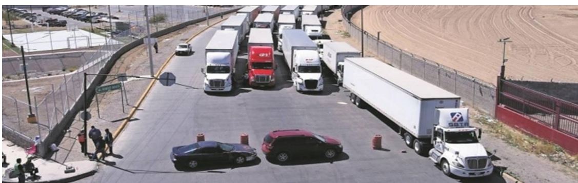
Transportistas aseguran que duran inmóviles hasta 20 horas para la inspección. Fotografía obtenida de: Crónica.

Fuente disponible en: https://www.economista.com.mx/politica/PRI-acusa-de-traidor-a-su-diputado-Carlos-Miguel-Aysa-porque-votara-a-favor-de-la-reforma-electrica-de-AMLO-20220413-0078.html