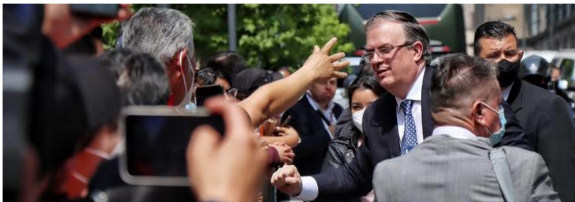
El canciller mexicano dijo que la política de México es muy abierta en cuanto a refugio. Fotografía obtenida de: El Sol de México.

Fuente disponible en: https://www.forbes.com.mx/aprueban-en-lo-general-el-dictamen-de-reforma-electrica-pasa-al-pleno/