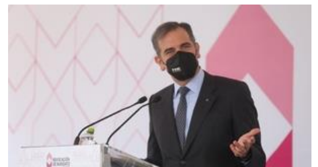
En 24 casillas se suspendió la votación por inseguridad o amenazas de violencia en cuatro estados.

El consejero presidente del Instituto Nacional Electoral (INE), Lorenzo Córdova, exhibió que se detectaron distritos electorales con votaciones "atípicas" las cuales rondaron e incluso superaron el 50 por ciento de la participación, y que se trata de zonas rurales.