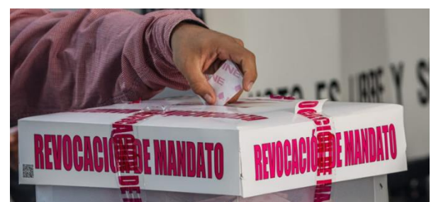
Revocación de Mandato.

De principio, la Constitución Política de los Estados Unidos establece en el artículo 35 el derecho a votar y ser votado, mismo que fue reformado en 2019 para agregar que se puede votar en las consultas populares sobre temas de trascendencia nacional o regional. Dicho esto queda claro que salir a votar es un derecho al que todos los mexicanos tenemos acceso, pero también es una obligación.