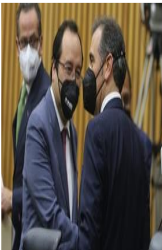
El consejero Lorenzo Córdova sostuvo que tienen clara su responsabilidad y la cumplen bien.

Fuente disponible en: https://www.milenio.com/politica/morena-promete-ine-votos-mexicanos-2024