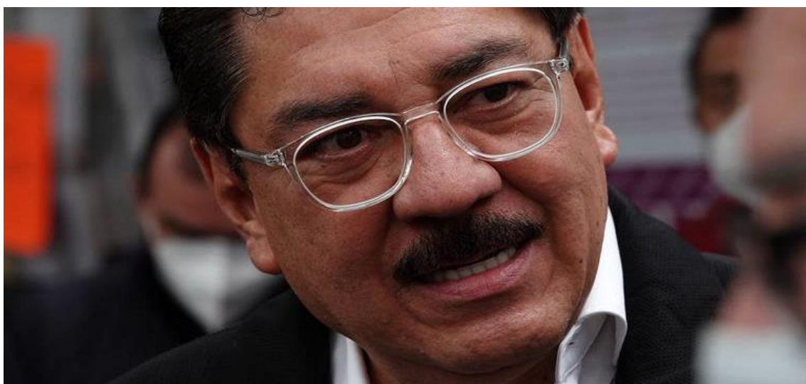
Este jueves el TEPJF informó que dio entrada al juicio de inconformidad que presentó el polémico exgobernador priísta. Fotografía obtenida de: El Sol de México.

Fuente disponible en: https://www.jornada.com.mx/notas/2022/04/14/politica/fideicomisos-estan-amparados-por-la-ley-su-operacion-es-transparente-ine/