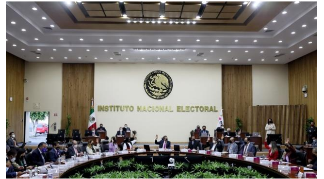
Sala de sesiones del Consejo General del INE.

En conjunto, los fideicomisos tienen un saldo de 1353.09 millones de pesos, de los cuales sólo 626.15 millones se encuentran disponibles, pero no pueden usarse para otros fines que los especificados, insistió en un comunicado.