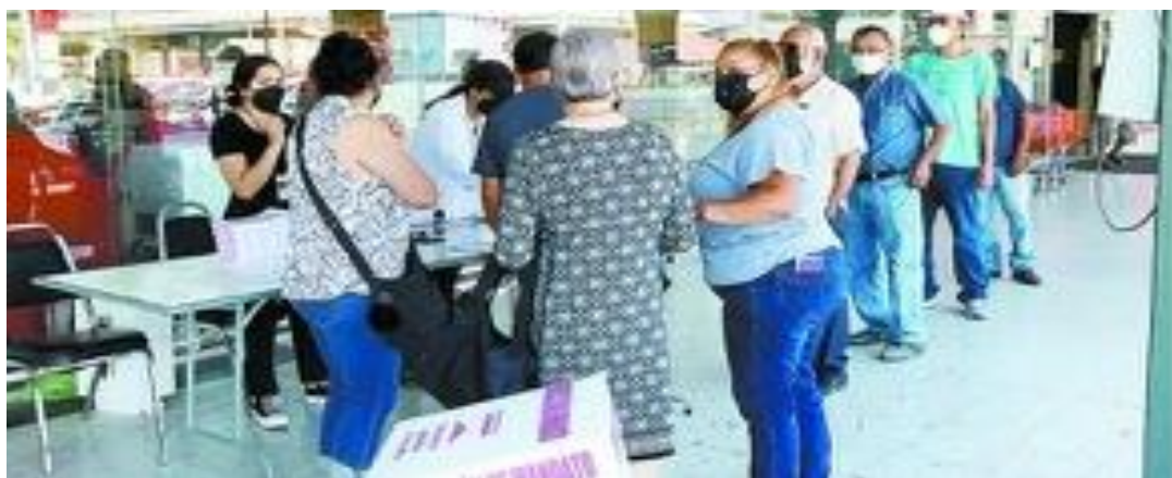
El municipio de Guadalupe fue el que tuvo mayor participación ciudadana. Fotografía obtenida de: Milenio.

Fuente disponible en: https://www.elsoldemexico.com.mx/mexico/politica/admite-amlo-que-delitos-de-feminicidio-han-aumentado-8133025.html