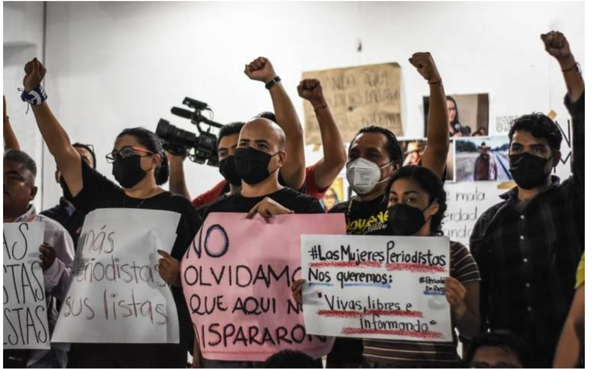
El mandatario precisó que abordaría temas de economía, obras, empleo y bienestar en su reporte trimestral.

El pasado 6 de abril, el presidente López Obrador informó que el gobierno destinará el 25% del presupuesto de publicidad de la administración federal, que asciende a unos tres mil millones de pesos, para crear un plan de seguridad social para los periodistas que no tengan este beneficio.