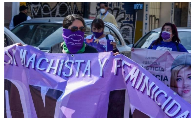
Protesta de mujeres por feminicidios en el Estado de México.

En el marco de su decimotercer informe de Gobierno, realizado en Palacio Nacional, el mandatario federal expresó que el robo de combustibles disminuyó en 95%, mientras que los homicidios defendieron