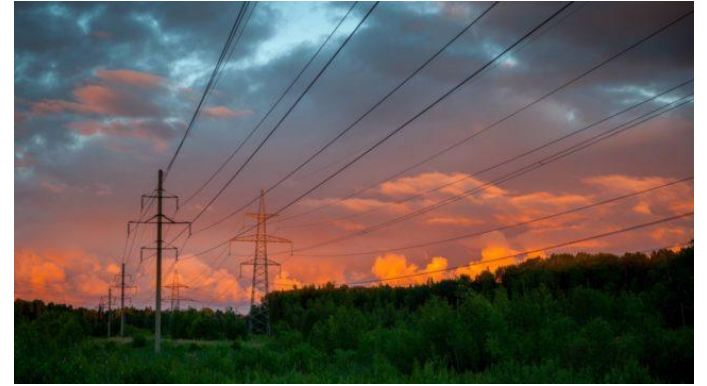
Aunque se haya aprobado en comisiones, la oposición advirtió que esta iniciativa del Ejecutivo no va a sobrevivir, pues irán en contra.