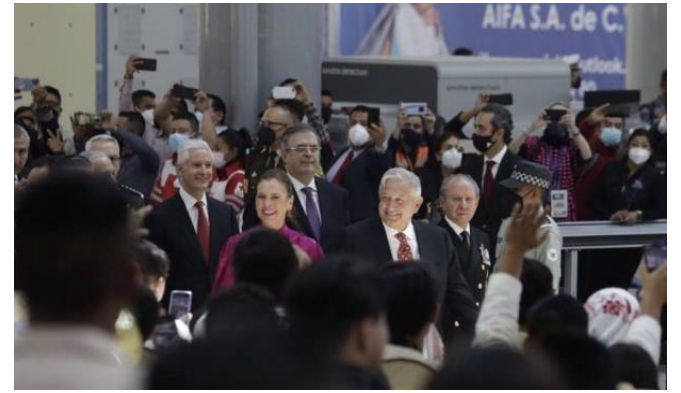
Gobernadores del Edomex, Hidalgo y la Jefa de Gobierno de la CDMX reconocieron la obra de la administración de López Obrador por haberse hecho con austeridad y sin endeudamiento.

“Se antepone la aportación a la nación a partir de un proyecto racional, coherente para el desarrollo urbano y la protección de los recursos naturales con visión de futuro. ¿Quiénes puede estar en contra de esto? Solo aquellos que miran solamente de sus intereses personales, aquellos que se beneficiaron por décadas por estar cerca del poder y que aún no entienden que