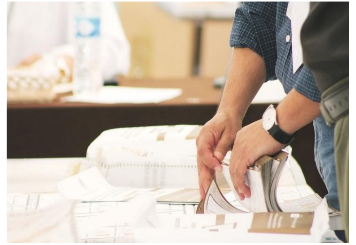
El consejero presidente del INE, Lorenzo Córdova, señaló que no hay irregularidad en la conformación del padrón electoral y de la lista nominal.

“Para tener un listado certero, confiable, es necesario tener una fecha de corte”, mencionó el consejero electoral.