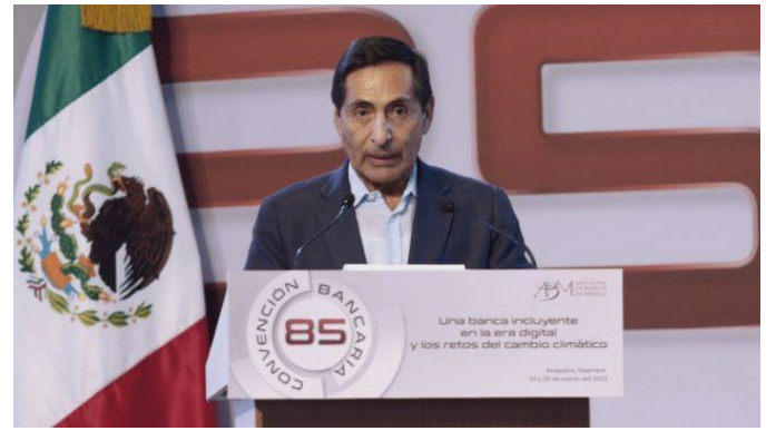
Rogelio Ramírez de la O, secretario de Hacienda y Crédito Público.

Cuestionado sobre si esta acción violentó las normas del Banco de México, el jefe del Ejecutivo federal se limitó a decir que el secretario de Hacienda forma parte del consejo del banco por lo que tiene acceso legal a la información.