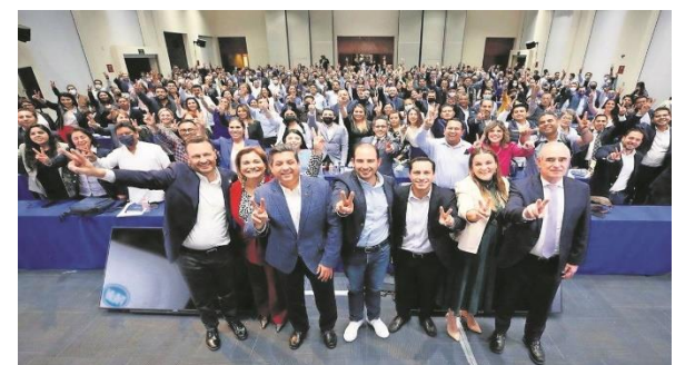
Cuatro mandatarios estatales participaron en el panel de Gobernadores.

A dos años de 2024 y con el objetivo de vencer a Morena, el miércoles pasado se dio el banderazo para la pasarela de aspirantes presidenciales ante la militancia del Partido Acción Nacional (PAN), con la participación de cuatro gobernadores: Mauricio Vila Dosal, de Yucatán; Francisco García Cabeza de Vaca, de Tamaulipas; Maru Campos Galván, de Chihuahua, y Mauricio Kuri González, de Querétaro.