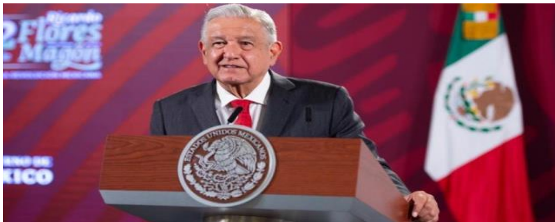
Presidente Andrés Manuel López Obrador. Fotografía obtenida de: Forbes

Fuente disponible en: https://www.eluniversal.com.mx/nacion/consulta-de-revocacion-de-mandato-de-amlo-va-con-lista-nominal-de-mas-de-92-millones-de-electores