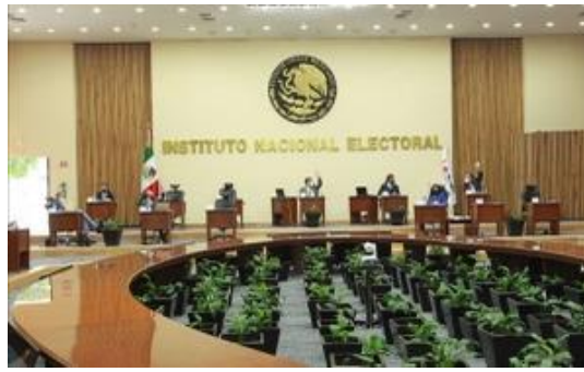
Instituto Nacional Electoral. Fotografía obtenida de: Cuartoscuro/Milenio.

Fuente disponible en: https://www.milenio.com/estados/llegan-guerrero-papeletas-consulta-revocacion-mandato