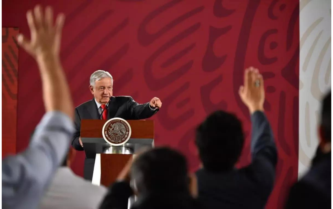
La Comisión determinó que se emitió propaganda gubernamental en conferencias matutinas del presidente Andrés Manuel López Obrador y en publicaciones de Facebook.

A petición del Partido Acción Nacional (PAN), los consejeros Adriana Favela, Ciro Murayama y Claudia Zavala, aprobaron eliminar publicaciones del gobierno federal en Facebook e instaron al Ejecutivo a evitar hacer menciones de sus obras, luego de analizar las menciones que se hicieron respecto a seguridad pública, obra pública, inversiones y estímulos fiscales, en el periodo prohibido por la próxima consulta ciudadana de revocación de mandato.