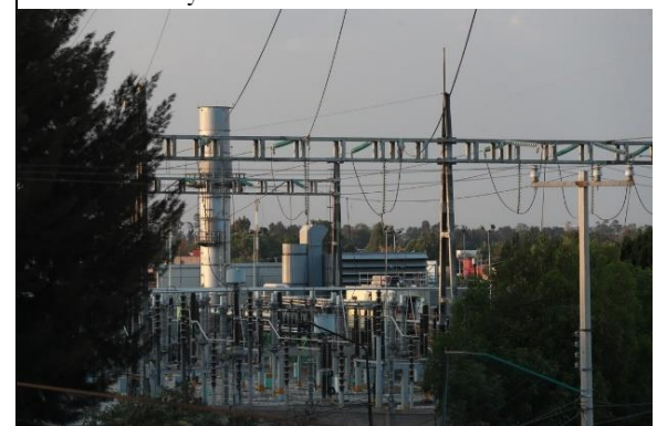
Subestación eléctrica en La Noria, Xochimilco.

En la reunión de este miércoles en la Junta de Coordinación Política, Morena propuso la fecha. Para ello, este jueves las juntas directivas de las comisiones unidas de Puntos Constitucionales y Energía –a las que se turnó la iniciativa- discutirán un acuerdo para definir la ruta de análisis, discusión y dictamen.