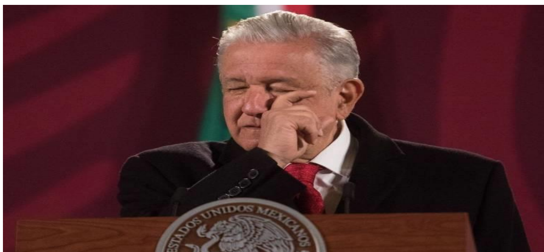
Será el 10 de abril que el Instituto Nacional Electoral llevará a cabo el proceso democrático. Fotografía obtenida de: Cuartoscuro/ El Sol de México.

Fuente disponible en: https://www.forbes.com.mx/politica-diputados-suspenden-discusion-ley-movilidad-posponen-proximo-martes/