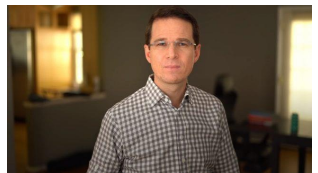
Anaya reapareció justo el día de la inauguración del AIFA para desmentir a AMLO sobre el tema del petróleo.

El panista Ricardo Anaya desmintió este lunes al presidente Andrés Manuel López Obrador al decir que fue el tabasqueño quien propuso no extraer el petróleo del subsuelo para dejar que las próximas generaciones lo aprovechen.