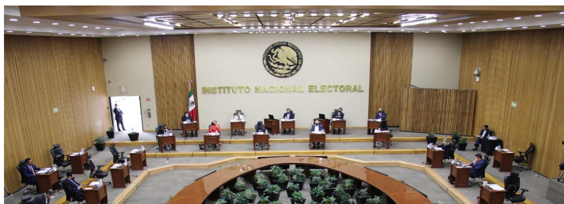
Sala de sesiones del Consejo General del INE.