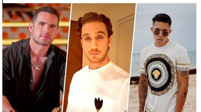
Algunos actores pagarán una multa mínima de 4 mil 481 pesos por promocionar al Partido Verde en plena veda electoral.

Un grupo de actores e influencers serán sancionados con una multa mínima por contar con una capacidad económica en ceros. Ante esto, la Sala Especializada del Tribunal determinó imponerles sanciones de 4 mil 481 pesos a cada