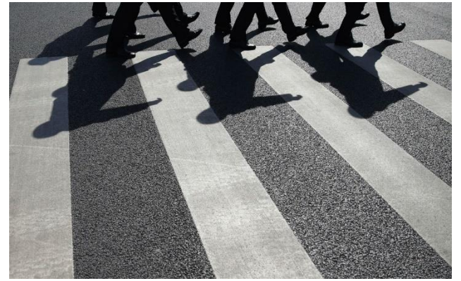
La nueva Ley General de Movilidad establece que a quienes sean sorprendidos manejando alcoholizados se les retirará la licencia de conducir.

- Para vehículos destinados al transporte de pasajeros y de carga, queda prohibido conducir con cualquier concentración de alcohol por espiración o litro de sangre.