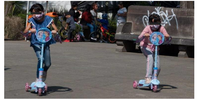
El delito se castigará con penas privativas de libertad que podrían alcanzar los 18 años de cárcel.

Esto, indicó, es producto del panorama que enfrentan las mujeres en los pueblos originarios, donde prevalecen los “Usos y Costumbres”, que en este caso deberían llamarse “Abusos y Costumbres”.