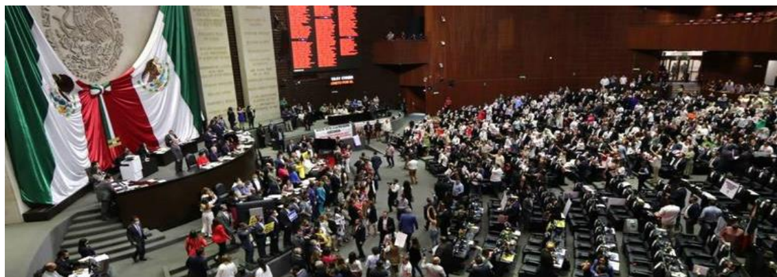
Comisiones Unidas de Derechos Humanos y de Justicia, de la Cámara de Diputados aprobaron con 56 votos a favor de la iniciativa. Fotografía obtenida de: El Sol de México.

Fuente disponible en: https://www.milenio.com/politica/senadora-pri-pide-ine-medidas-cautelares-amenazas-mier