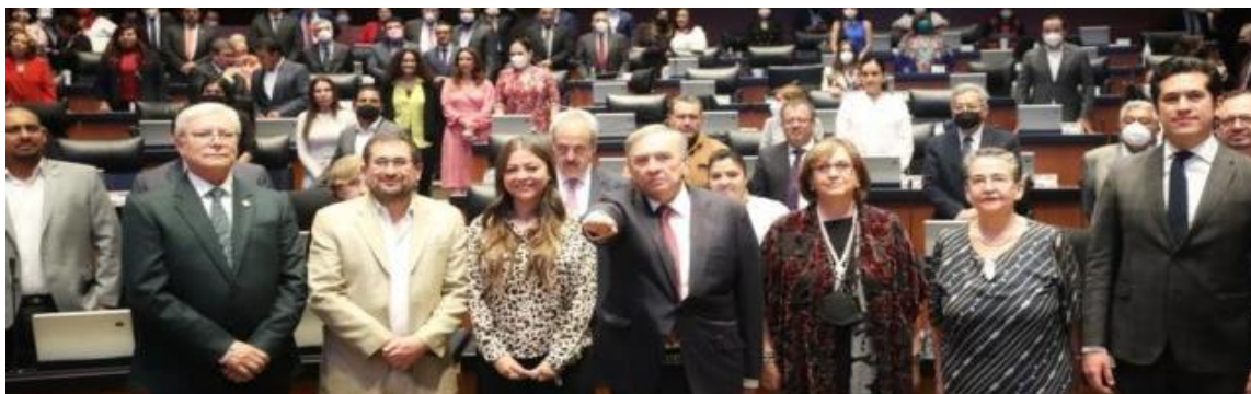
En medio de críticas de la oposición, el Senado con mayoría de Morena ratificó a Carlos Aysa González como embajador de República Dominicana. Fotografía obtenida de: Forbes

Fuente disponible en: https://www.elsoldemexico.com.mx/mexico/politica/aprueba-n-ley-para-castigar-matrimonios-forzados-y-venta-de-ninas-8198199.html