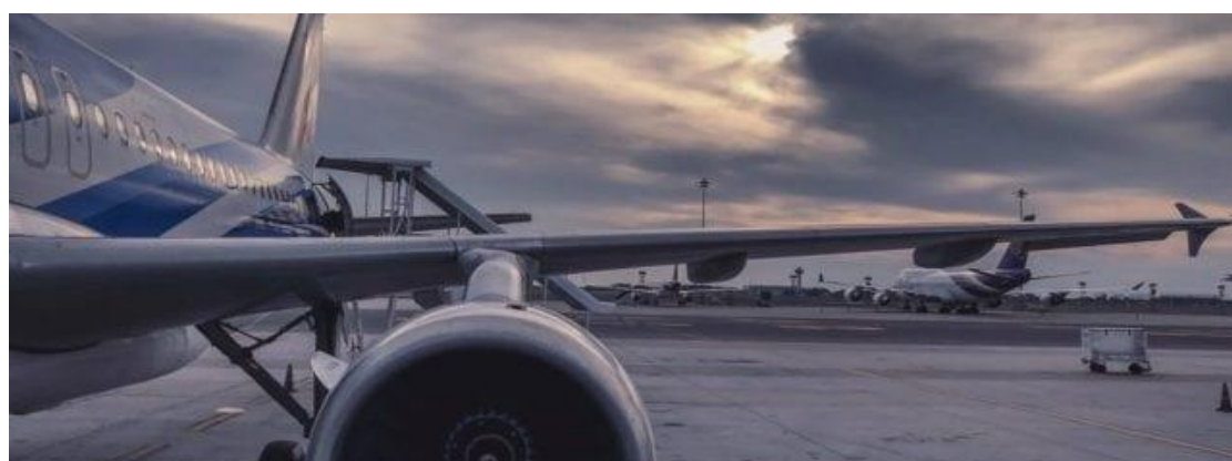
El mandatario presentó una iniciativa para crear la Ley de Protección del Espacio Aéreo Mexicana, a fin de inhibir delitos en el aire.

Fuente disponible en: https://www.elsoldemexico.com.mx/mexico/politica/pr- esidente-presidente-diputados-de-la-4t-destapan-a-adan-augusto-rumbo-al-2024-8205815.html