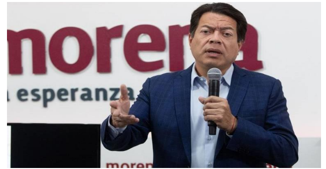
Deben retirarse las publicaciones en contra de los legisladores de oposición que votaron en contra de la reforma eléctrica.

La solicitud de media cautelar en contra de Morena y su líder político, fue solicitada por el Partido Revolucionario Institucional (PRI), bajo el argumento de una presunta calumnia y por difundir una publicación con la que, según el PRI, pretenden restarle simpatía frente al electorado de cara a los procesos electorales locales en curso.