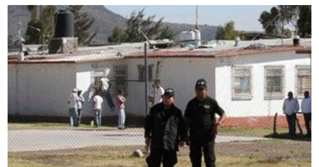
El sufragio de este sector de la población se llevará a cabo los días 16,17 y 18 de mayo.

Únicamente 130 personas en prisión preventiva en Hidalgo podrán votar en la elección del próximo cinco de junio para renovar la gubernatura de Hidalgo, informó el Instituto Nacional Electoral (INE) en la entidad, esto a pesar de que se cuenta con un universo de mil 500 personas bajo esta condición en 13 centros penitenciarios del territorio estatal.