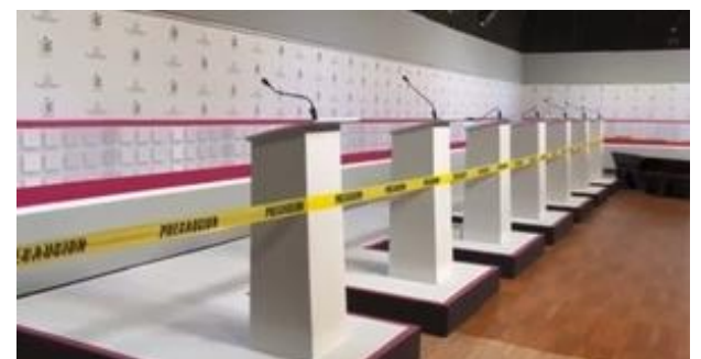
El debate en Oaxaca fue cancelado.

En sesión extraordinaria urgente, la Comisión Temporal de Comunicación del Instituto Estatal Electoral y de Participación Ciudadana de Oaxaca (IEEPCO), aprobó por unanimidad el acuerdo IEEPCO-CTC-04/2022, mediante el cual se determinó que es ya improcedente por falta de tiempo la reprogramación del primer debate a la gubernatura que se canceló el domingo pasado, ante la falta de quórum de los asistentes.