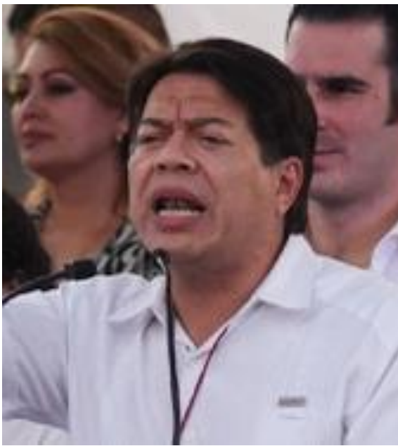
Mario Delgado, presidente de Morena, durante una asamblea.

La Comisión de Quejas y Denuncias del INE ordenó al presidente de Morena, Mario Delgado, a la secretaria del partido, Citlalli Hernández, y al secretario de comunicación, Diego Hernández, eliminar y no volver a repetir, publicaciones o comentarios en los que calumnien y fomenten la campaña de odio en contra de legisladoras y legisladores de oposición a los que llaman “traidores a la patria”.