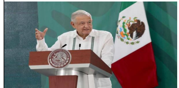
El titular del Ejecutivo federal aconsejó que quien quiera participar en la encuesta para el 2024 que lo haga.

En conferencia de prensa matutina en las instalaciones de la Décima Brigada de Policía Militar, el titular del Ejecutivo federal manifestó que “ya no queremos que haya tapados” pues indicó que aquella persona que quiera participar en la elección que lo haga.