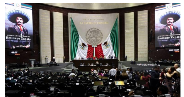
Sesión Ordinaria de la Cámara de Diputados.

La Cámara de Diputados recibió del Ejecutivo federal la iniciativa con proyecto de decreto por el que se reforman, adicionan y derogan diversas disposiciones de la Ley Orgánica de la Administración Pública Federal, en donde la da mayores facultades a la Secretaría de la Función Pública (SFP), para administrar las finanzas de la Hacienda Pública.