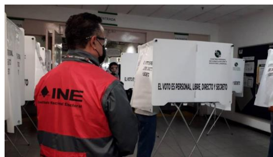
Seis gubernaturas estarán en juego este junio 5 de 2022.

En su respuesta, aseguró que Robles Berlanga había participado en la Estafa Maestra, misma que había provocado un daño grave a la nación, a pesar de que ella no había sido encontrada culpable por ningún juez.