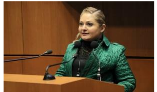
Claudia Anaya, senadora del PRI.

coordinadora del PAN, lamentó que el coordinador de Morena en la Cámara Baja, incite al odio y a la violencia.