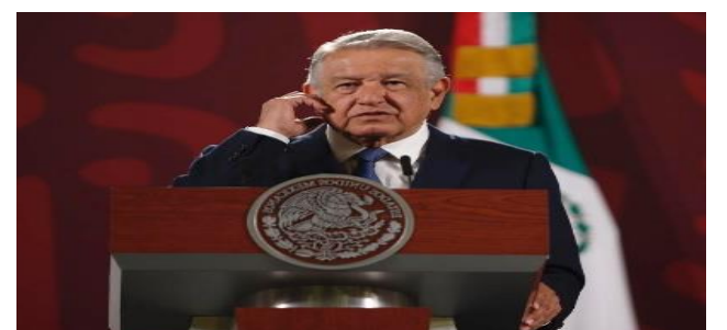
El presidente Andrés Manuel López Obrador durante la conferencia de prensa matutina en Palacio Nacional, el 15 de agosto de 2022.

Emir Olivares y Alonso Urrutia La Jornada