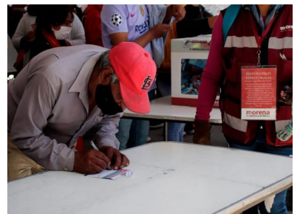
Elección de Morena el pasado julio.

Fermín Alejandro García La Jornada de Oriente