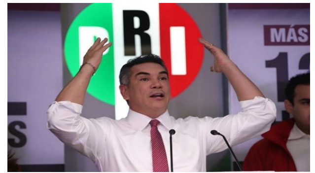
Alejandro Moreno en conferencia de prensa.

Los integrantes de la alianza Va por México convocaron a una conferencia de prensa, la cual fue realizada en un hotel de cinco estrellas de Paseo de la Reforma, donde además de los presidentes partidistas acudieron otros prominentes miembros de dichas fuerzas políticas. En el estrado estaban algunos sobre los que se han fincado distintas denuncias administrativas o penales.