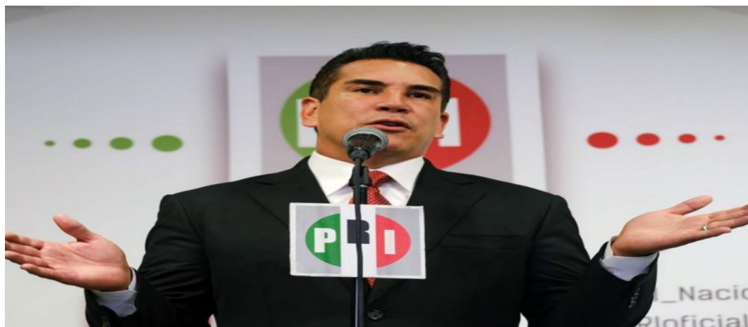
El líder del PRI, Alejandro Moreno, “Alito”, en conferencia en agosto de 2019. Fotografía obtenida de: Excelsior.

Fuente disponible en: https://www.jornada.com.mx/notas/2022/08/18/politica/pri-se-lanza-contrasales-por-pedir-desafuero-de-alito-moreno/