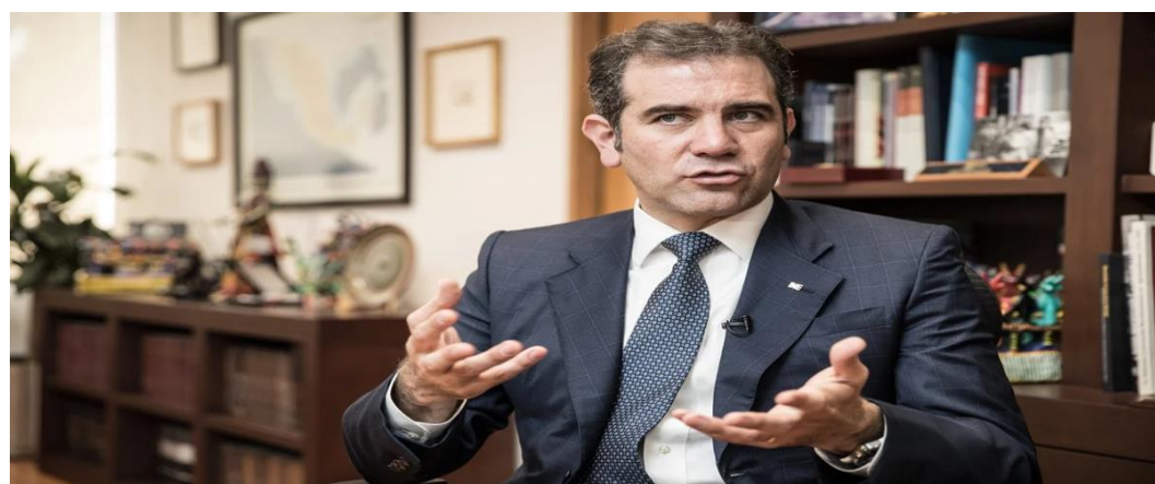
Lorenzo Córdova. Fotografía obtenida de: Archivo/El Universal.

Fuente disponible en: https://politica.expansion.mx/presidencia/2022/08/17/amlo-estrategia-de-seguridad-es-abrazos-no-balazos