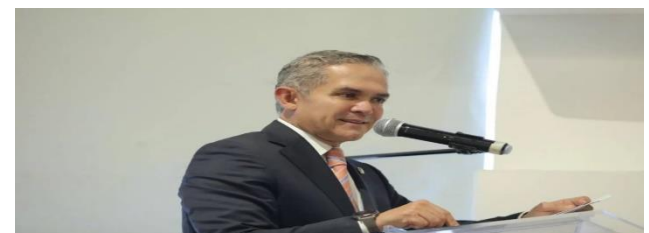
El evento de mañana estará encabezado por Miguel Ángel Mancera.

La bancada del PRD en el Senado alista su reunión plenaria de cara al próximo periodo ordinario de sesiones, donde la agenda legislativa que se perfila tiene como temas prioritarios la reforma electoral, gobiernos de coalición y seguridad pública. Miguel Ángel Mancera,