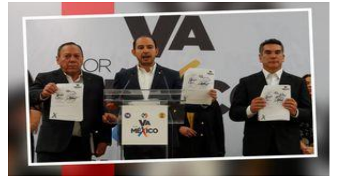
La alianza Va por México aún no deciden si irán en conjunto para la gubernatura del Edomex.

De acuerdo con el Instituto Electoral del Estado de México (IEEM) en los comicios de 2021 los candidatos priistas a presidentes municipales de Cuautitlán Izcalli, Chalco, Ecatepec, Huixquilucan, Naucalpan, Nezahualcóyotl, Texcoco, Tlalnepantla, Toluca y Valle de Chalco sumaron 566 mil votos, pero los de Morena se hicieron con 988 mil sufragios.