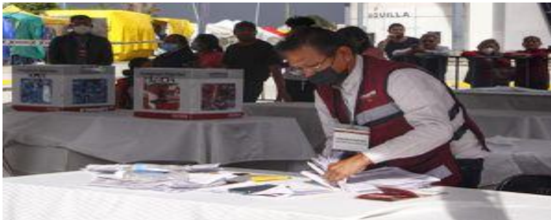
Concluye elección de consejeros de Morena en Puebla. Fotografía obtenida de: Milenio.

Fuente disponible en: https://www.milenio.com/politica/va-por-mexico-desfondada-para-eleccion-a-gobernador-de-edomex