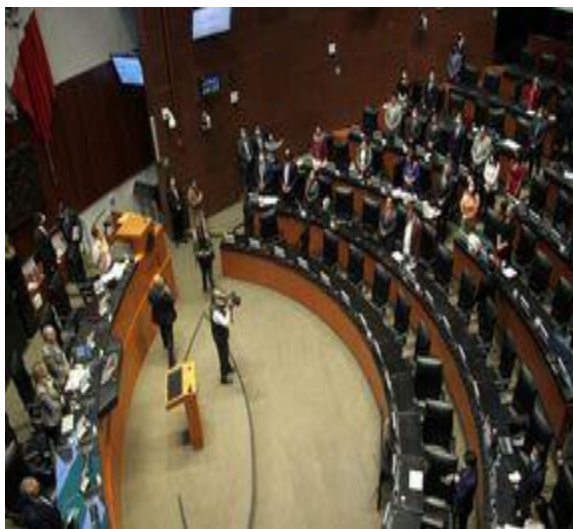
Se llevó a cabo la Sesión de la Comisión Permanente en el Senado de la República.

A 15 días de que inicie el próximo periodo ordinario de sesiones, los morenistas no han llegado a un acuerdo sobre quién presidirá el organismo.