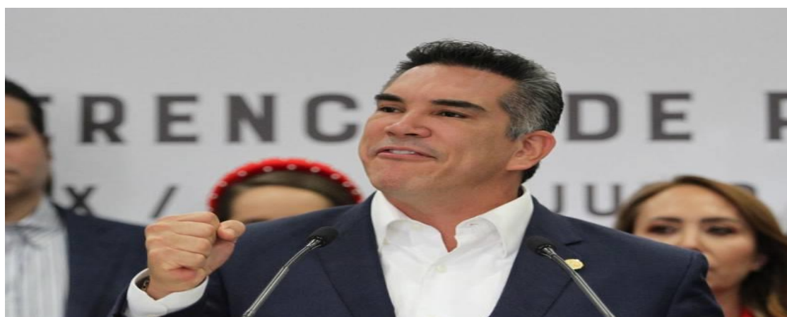
Alejandro Moreno ha sido acusado por enriquecimiento ilícito por la Fiscalía de Campeche.

https://www.milenio.com/politica/congreso/francisco-cienfuegos-asegura-diputados-quedan-pri