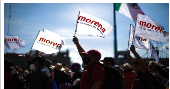
Este 21 de agosto en la Segunda Convención Nacional Morenista.

"Defendamos la esperanza y los principios de nuestro movimiento: No mentir, no robar y no traicionar", es el llamado que los morenistas disidentes lanzaron.