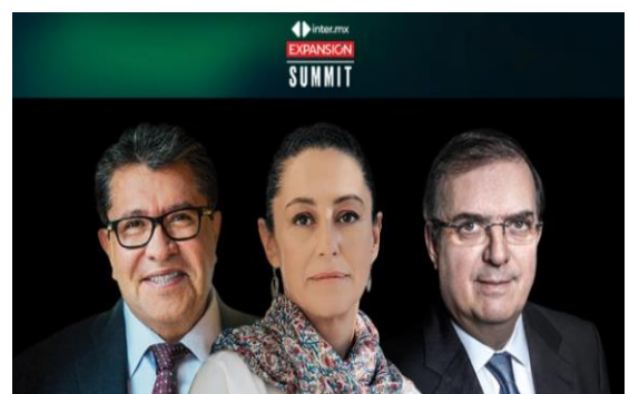
Los tres aspirantes de Morena manifestaron su postura respecto del destape que hizo el presidente hace un año.

- “Yo he sido parte de este movimiento que encabeza el presidente López Obrador desde siempre, desde el inicio, desde que surgió, ahí hemos estado en las buenas, y hemos estado en las malas”.