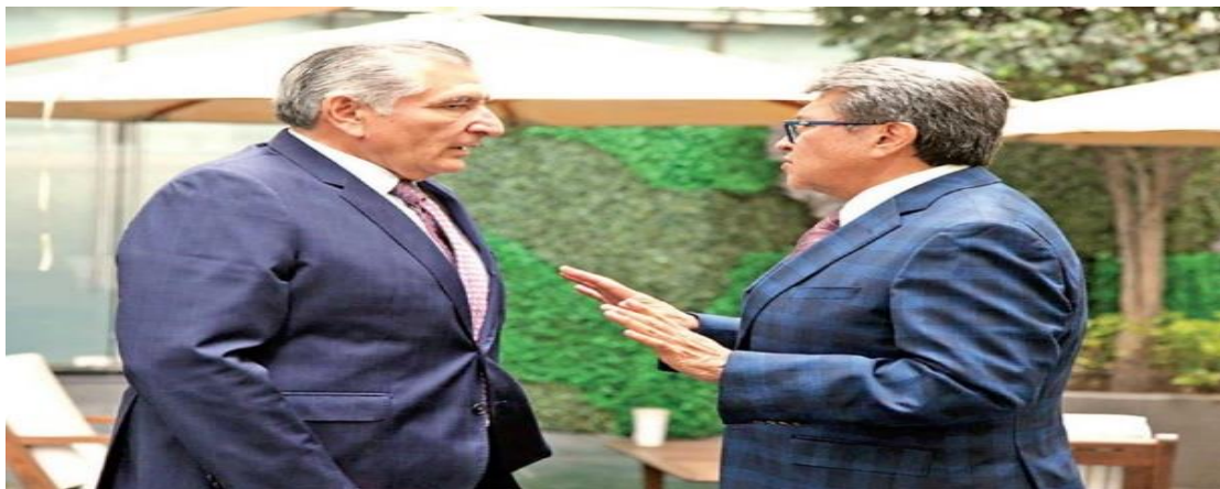
El 13 de agosto el titular de Gobernación, Adán Augusto López, se reunió con el senador Monreal para cabildear la reforma. Fotografía obtenida de: Excelsior.

Fuente disponible en: https://elpais.com/mexico/2022-09-16/mexico-propone-un-comite-en-la-onu-para-la-paz-en-ucrania-integrado-por-el-presidente-de-la-india-y-el-papa-francisco.html