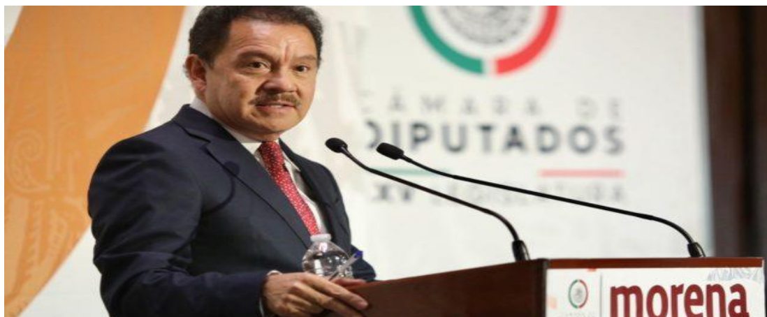
Ignacio Mier, coordinador de Morena en la Cámara de Diputados.

https://www.eleconomista.com.mx/politica/Reforma-para-ampliar-la-presencia-del-Ejercito-en-las-calles-pone-en-gravissimo-riesgo-al-sistema-democratico-del-pais-PAN-y-PRD-20220914-0095.html