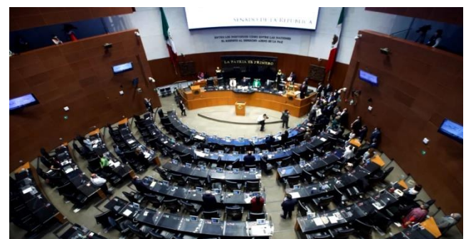
Senado de la República.

"Voy a convocar a los senadores y senadoras para evaluar esta reforma que acompañará a las Fuerzas Armadas, a la Guardia Nacional por un tiempo más de cinco años, esto en medio del debate nacional que se ha dado en estos días, estaré informando respecto al trabajo legislativo".