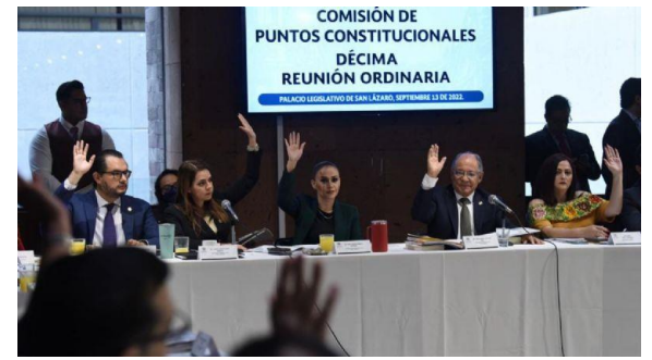
Sesión de la Comisión de Puntos Constitucionales de la Cámara de Diputados.

“Durante los diez años siguientes a la entrada en vigor del presente Decreto, en tanto la Guardia Nacional desarrolla su estructura, capacidades e implantación territorial, el Presidente de la República podrá disponer de la Fuerza Armada permanente en tareas de seguridad pública de manera extraordinaria, regulada, fiscalizada, subordinada y complementaria; dicha participación deberá tener un enfoque de respeto a los derechos humanos, así como a los derechos de los pueblos y comunidades indígenas”, dice la reserva presentada por el PRI.