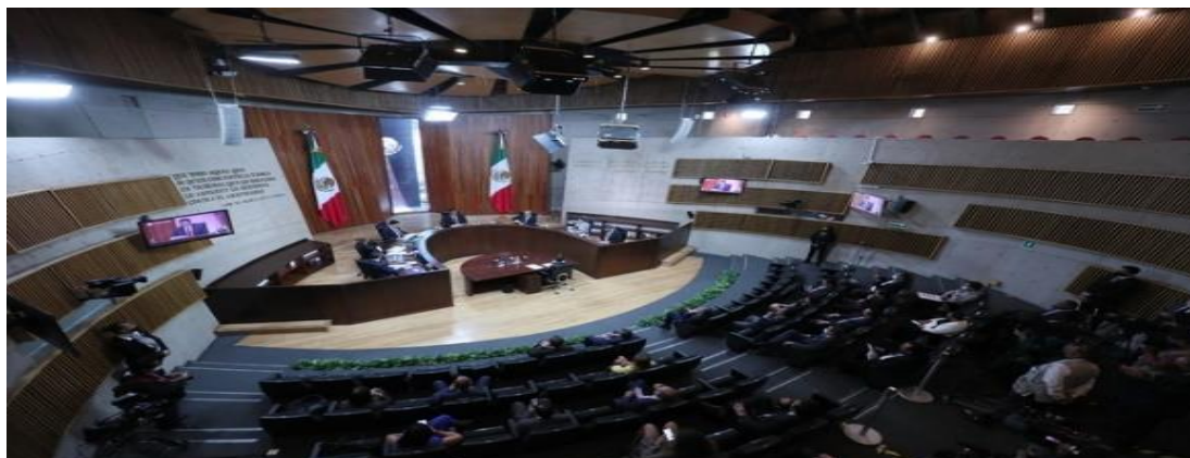
Sala de sesiones del TEPJF en imagen de archivo. Fotografía obtenida de: La Jornada.

Fuente disponible en: https://www.proceso.com.mx/nacional/politica/2022/9/13/morena-pri-aprueban-en-comisiones-extender-10-anos-la-presencia-militar-en-las-calles-293244.html