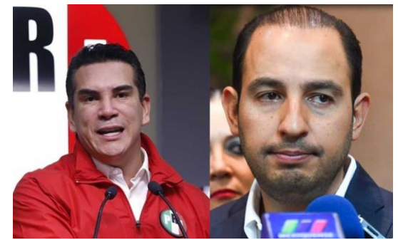
Líderes nacionales del PRI y PAN.

"Estaremos observantes de cómo actúan los legisladores en el Senado de la República, nosotros confiaríamos en que ahí se va a corregir la plana y de esa