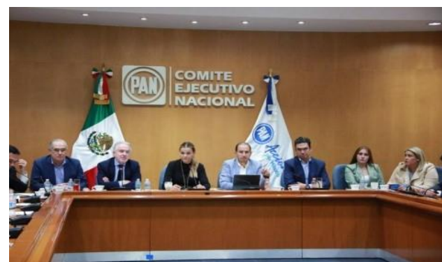
Comisión Permanente Nacional del PAN en reunión.

Los integrantes del Comité Ejecutivo Nacional del Partido Acción Nacional (PAN), a través de su Comisión Permanente Nacional, respaldaron a su dirigente nacional, Marko Cortés, en la determinación de suspender temporalmente los trabajos de la alianza Va por México con el PRI.