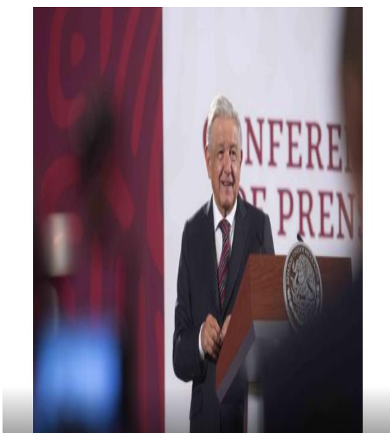
AMLO en conferencia de prensa.