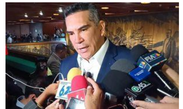
Presidente nacional del PRI, Alejandro Moreno.

La Sala Superior del Tribunal Electoral del Poder Judicial de la Federación se limitó a señalar que “del análisis de la queja no se observan hechos que constituyan conductas infractoras de la normativa electoral que den lugar a un proceso sancionador”.