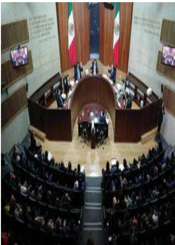
Sala Superior del Tribunal del Poder Judicial de la Federación.

A dos semanas de que entre en funciones la nueva administración estatal, integrantes del Poder Legislativo mantienen una disputa jurídica sin precedente desde la Suprema Corte de Justicia de la Nación y el Tribunal Electoral del Poder Judicial de la Federación.