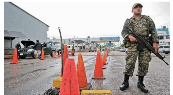
Guardia Nacional.

“Es una reforma condenable en el fondo, pero también en la forma, porque fue propuesta y votada por la mayoría de los diputados priistas en una evidente complicidad con Morena; claudicando y contradiciéndose a lo que reiteradamente la dirigencia nacional de este partido y sus legisladores habían pronunciado al respecto de la peligrosa militarización y la fallida estrategia de los abrazos”, dijeron.