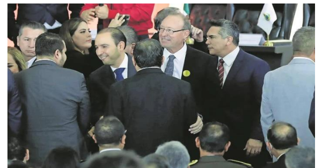
Aunque en algún momento Cortés y Moreno estuvieron cerca, no se hablaron.

Antonio López y Víctor Gamboa El Universal